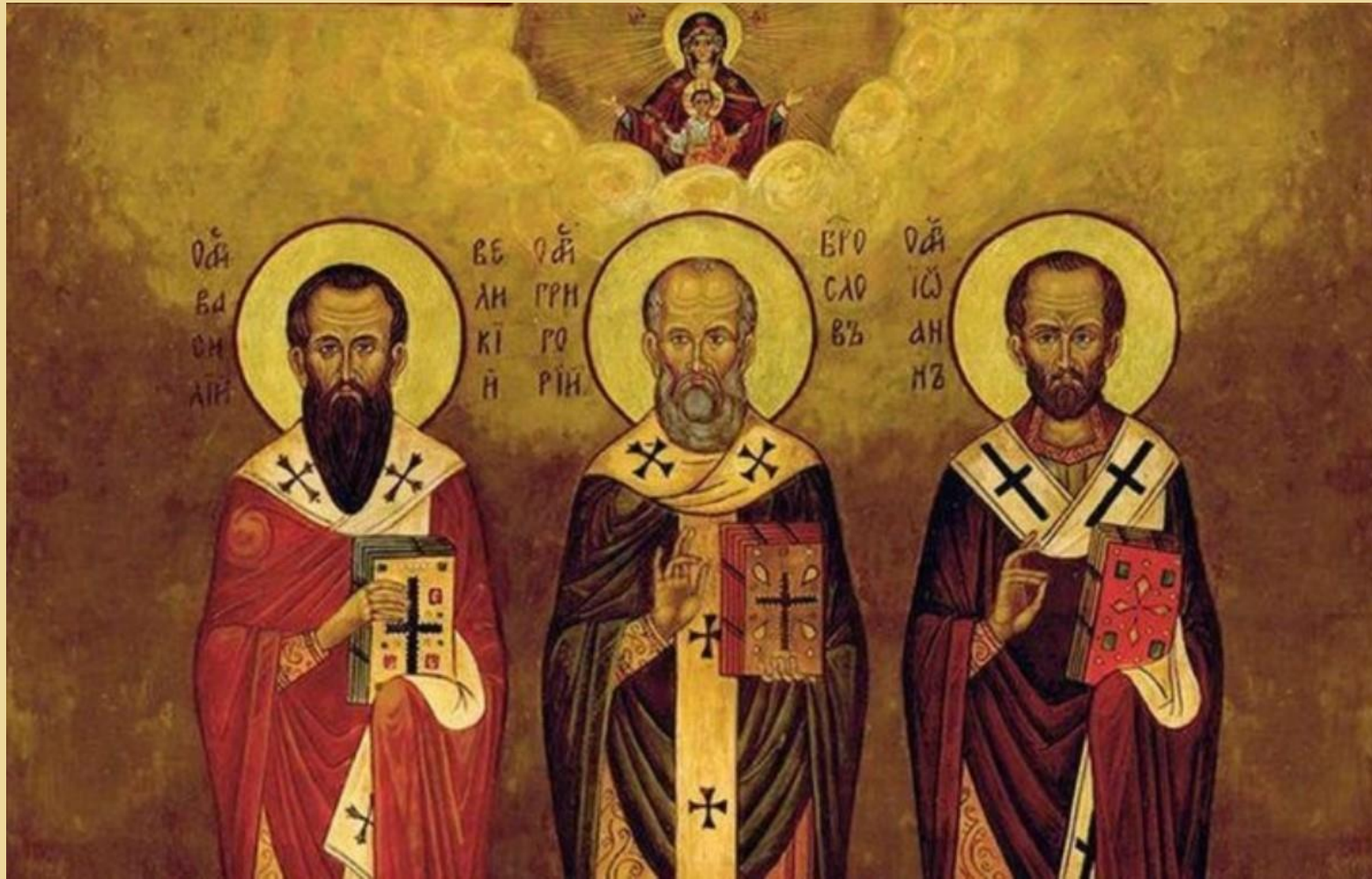
Григорий Богослов, Григорий Нисский и Иоанн Златоуст.